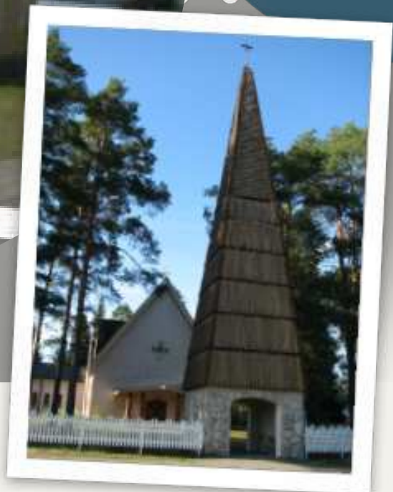
Tikkalan kappeli (2007, Katriina Puustinen.) Kemien seurakuntatalo, Pitäjäntupa, (2009, Henna Partanen.) Värtsilän kirkko (2011, Soile Luukkainen)

-Hyvän elämän puolesta paikkakunnillamme-